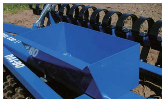
●ストーンボックス (マキシロール530 には取付不可)