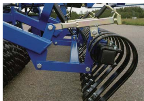
●クラッカーボード