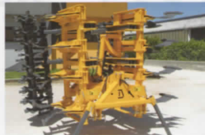
作業幅4mの大型折畳スピードプラウ！ 移動時は、3m幅になります。