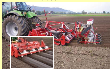
ニンジン播種アタッチメント