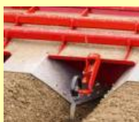
条間サブソイラー