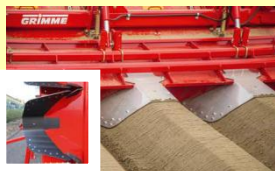
EXシェーピングボード