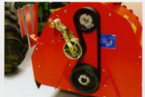
自動ベルトテンションシステム