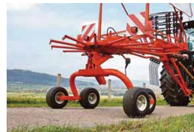
※写真は海外仕様の為実際とは異なる場合があります。

ティンアームは簡単に取外し可能です。本機の前側のラックに収納すれば、トラクターで持ち上げる際の油圧への負担が軽減できます。